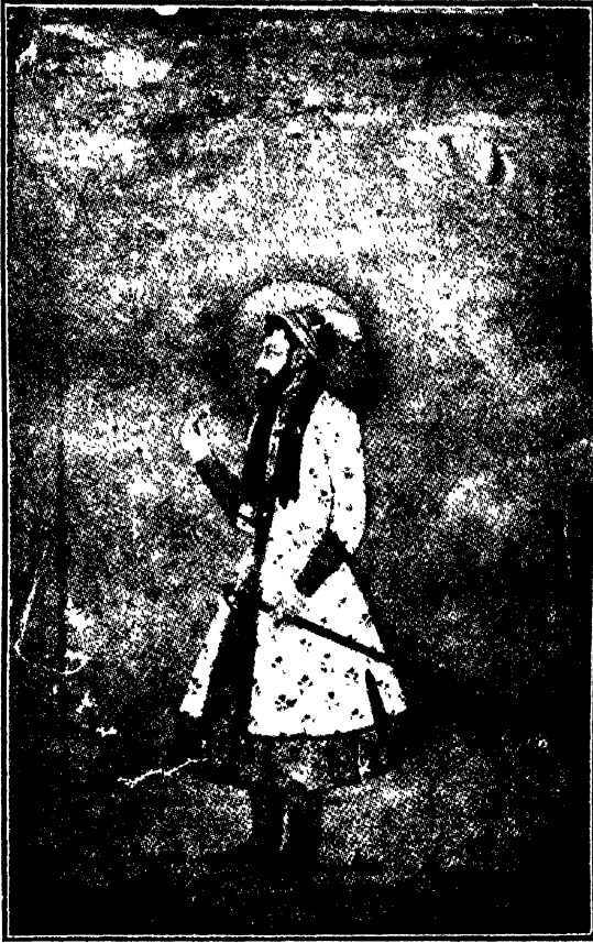
औरंगज़ेब ( युवा )